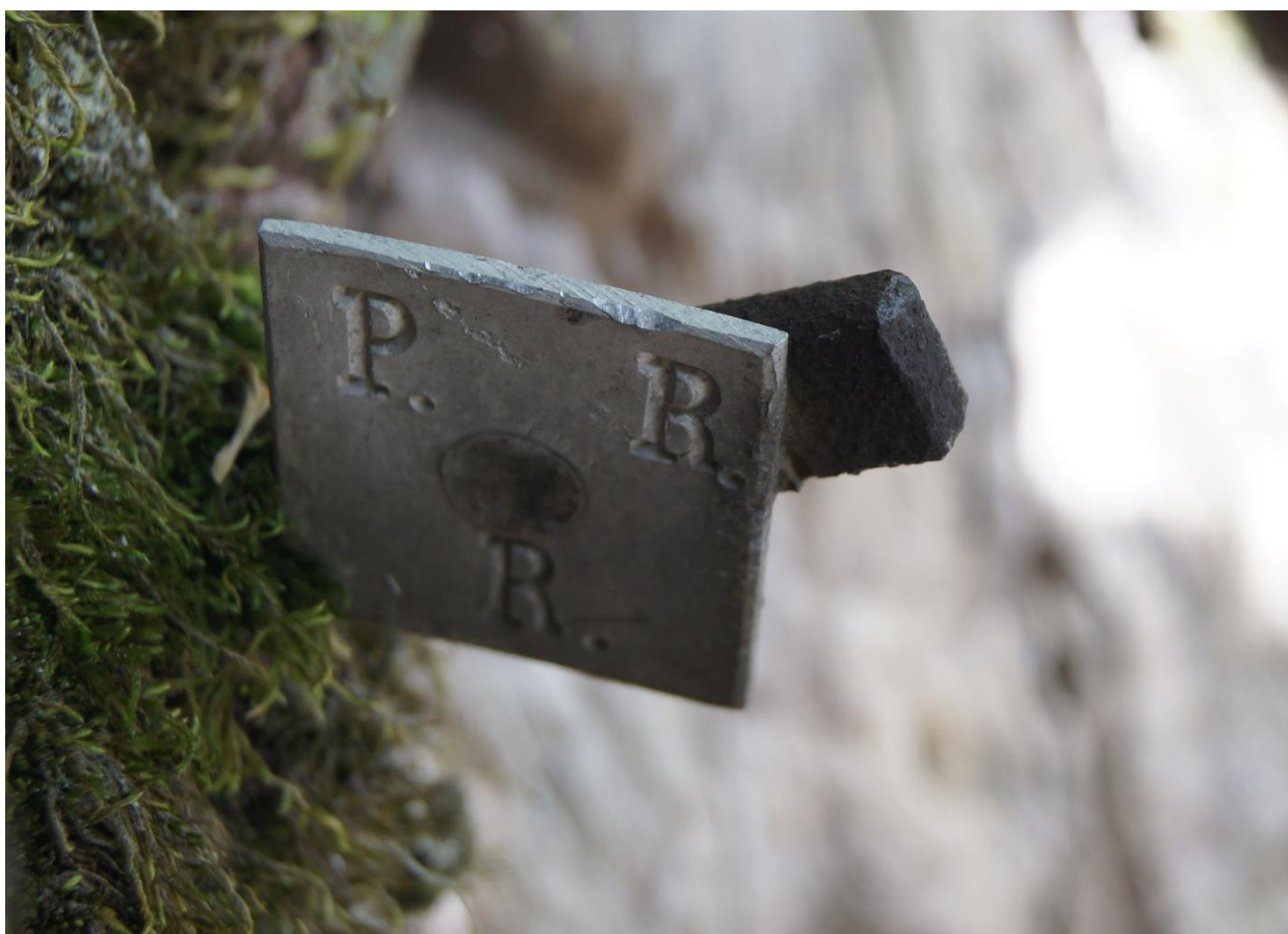
FIG. V. Alcune piante nel Pian dela Madonna di Roveredo (terreno patriziale) sono ancora contrassegnate con targhetta metallica infissa nel tronco, a circa quattro metri d'altezza.

Queste piante sono distinte visivamente con diversi tipi di contrassegno, che nello specifico di Roveredo spaziano dal colorare la corteccia all'incisione delle iniziali (nome e cognome) nel tronco dell'albero 39 , fino all'affissione di apposite targhette metalliche, come avviene anche in altre località della Svizzera italiana 40 . Per ringiovanire la pianta e aumentarne la resa, il proprietario in genere la capitozza attorno ai tre metri d'altezza, e dall'anno seguente – per usare i termini dialettali in uso a San Vittore - dal pesciuch (ceppaia) spuntano sia i furlón (polloni, che vanno tolti) che la casciada 41 (nuova corona di rami), la quale dopo tre anni viene innestata ( busctada , in dialetto). Se la resa dell'albero risulta insoddisfacente, a Verdabbio il privato è tenuto a sradicare la vecchia ceppaia e dopo aver chiesto l'autorizzazione (la grazia ) al comune o al patriziato, procede con l'impianto di un nuovo albero, mantenendo così il diritto in quel medesimo luogo. La richiesta obbligatoria della grazia rappresenta soprattutto una garanzia per l'ente territoriale di veder crescere piante sane e fruttifere, in grado di sopperire al meglio al fabbisogno alimentare della comunità.