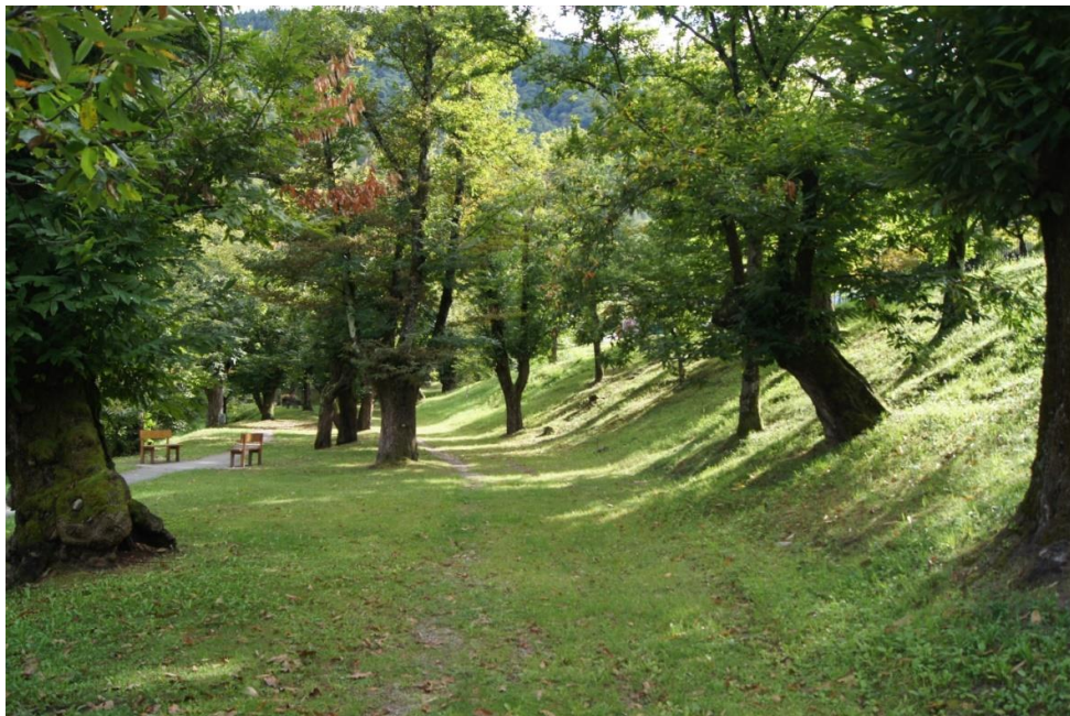
FIG. VI. Scorcio del Pian dela Madonna a Roveredo, terreno patriziale con alberi assorbiti nel patrimonio comunale a partire dalla fine degli anni '70. Foto Gionata Pieracci 2018.

Al giorno d'oggi nelle principali valli dell'Alto Ticino, stando alle informazioni appena raccolte da Laurianti presso le sezioni forestali, sopravvivono solo rare forme relittuali legate allo jus plantandi . Nello specifico di Roveredo, secondo le mie indagini, questo diritto viene abolito