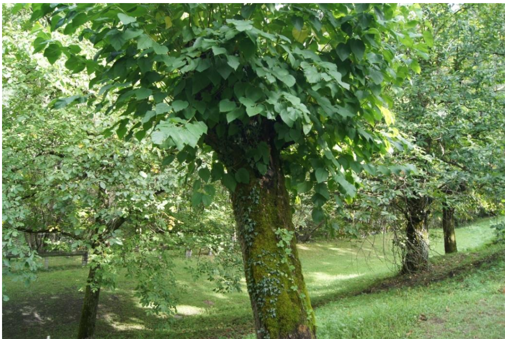
FIG. IV. Pian dela Madona a Roveredo GR, maggior terreno (oggi completamente comunale) in cui si esercitava lo jus plantandi ; interessante che accanto ai castagni (a destra) sporadicamente si trovino anche noci (a sinistra) e persino gelsi (al centro un gelso, in dialetto morón ). Foto Gionata Pieracci 2018.

Ma concentriamoci ora sulla zona non coperta dall'analisi del dottorando genovese. Lo storico ticinese Romano Broggin, in un suo studio del 1968 36 , ci fornisce una serie di notizie puntuali 37 sullo jus plantandi nel Moesano (citato a Grono come jus plantandis ). Il ricercatore ticinese ne riscontra tracce sia in Mesolcina (San Vittore, Roveredo, Grono, Verdabbio e Soazza) che in Val Calanca (Castaneda e Santa Maria). Reputo interessante il caso anomalo di questi due assolati villaggi della Calanca esterna, unico luogo in tutta la Svizzera italiana dove egli incontra piante comunali su terreni privati, segnale a mio avviso di un'economia del castagno particolarmente intensa 38 . Sempre a Castaneda lo jus plantandi gode di largo utilizzo e si presenta in varianti originali, perché si ha notizia anche di meli privati piantati sul terreno di un altro proprietario. Il castagno non ha quindi l'esclusiva assoluta; molto spesso si incontrano noci e ciliegi, mentre a Roveredo e a Grono anche gelsi, così come si citano salici in jus plantandi a San Vittore e Roveredo, testimonianze indirette di sericoltura e rispettivamente viticoltura. Di regola i salici si possono piantare lungo i corsi d'acqua o sulle rive lacustri, territori tradizionalmente della comunità. Ed è proprio lungo la Moesa che tra San Vittore e Roveredo risulta possibile piantare salici su terreno pubblico.